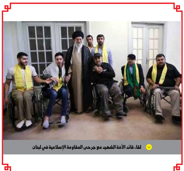
لقاء قائد الأمة الشهيد مع جرحى المقاومة الإسلامية في لبنان

وفي الختام، قال الدكتور الهمداني: نعزي الأمة الإسلامية، والجمهورية الإسلامية في إيران، ودول محور المقاومة، وكل أحرار العالم باستشهاد قائد الأمة ونعاهد أن تبقى رايته مرفوعة، وأن يبقى خطه حاضراً في ميادين الوعي والجهاد والبناء. رحم الله الإمام الشهيد رحمة واسعة، وجزاه عن الإسلام وفلسطين واليمن والمستضعفين خير الجزاء والسلام على الشهداء الذين يرحلون أجساداً، ويبقون في الأمة طريقاً لا ينطفئ.