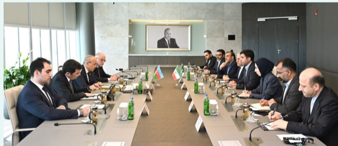
جنوب القوقاز، ويسعى البلدان من خلال تطوير التعاون في المجالات الاقتصادية

ألف دولار، مما يشير إلى نمو بنسبة ٧/٩٪ مقارنة بالفترة نفسها من عام ٢٠٢٥. وخلال هذه الفترة، بلغت صادرات جمهورية أذربايجان إلى إيران مليونين و ٨٠٠ ألف دولار، مسجلة انخفاضاً بنحو ٤٢/٩٪ مقارنة بالربع الأول من العام الماضي. وفي المقابل، ارتفعت واردات جمهورية أذربايجان من إيران بنسبة ٩/٥٪ لتصل إلى ١٦٦ مليوناً و ٧٠٠ ألف دولار. وبحسب تقرير الجمارك الأذربايجانية، لا تزال الجمهورية الإسلامية الإيرانية أحد الشركاء التجاريين المهمين لهذا البلدي منطقة