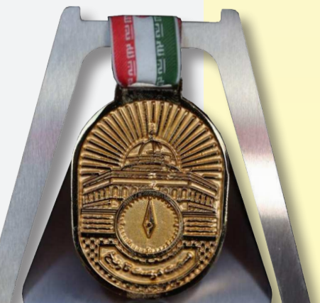
لقد وتُدرّ في الجهة الصحيحة من التاريخ You are standing on the right side of history