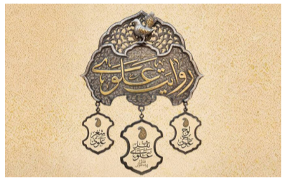
مهرجان «الرواية العلوية»

الوفاق/ يستذكر الملايين من المسلمين اليوم الرابع والعشرين من ذي الحجة، الذي يصادف اليوم الأربعاء ١٠ يونيو، حدث المباهلة بين النبي محمد (ص) ونصارى نجران، وهو يوم تألق نوره بين الأيام المشعة في الرسالة المحمدية، وهو يوم مشهود حقت فيه كلمة الله العليا وتمت فيه الغلبة للإسلام. واقعة المباهلة من الأحداث التي وقعت في صدر الإسلام، والتي تعتبر من علامات أحقية دعوة رسول الله (ص)، كما تدل على فضيلة النبي (ص) والذين معه في المباهلة، وهم الإمام علي (ع)، والسيدة فاطمة الزهراء (ع)، والإمامين الحسن والحسين (ع). ولقد تحدثت الآية ٦١ من سورة آل عمران حول واقعة المباهلة؛ ولذلك تُعرف هذه الآية بأية المباهلة.