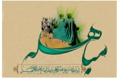
إقامة مهرجان «الرواية العلوية»