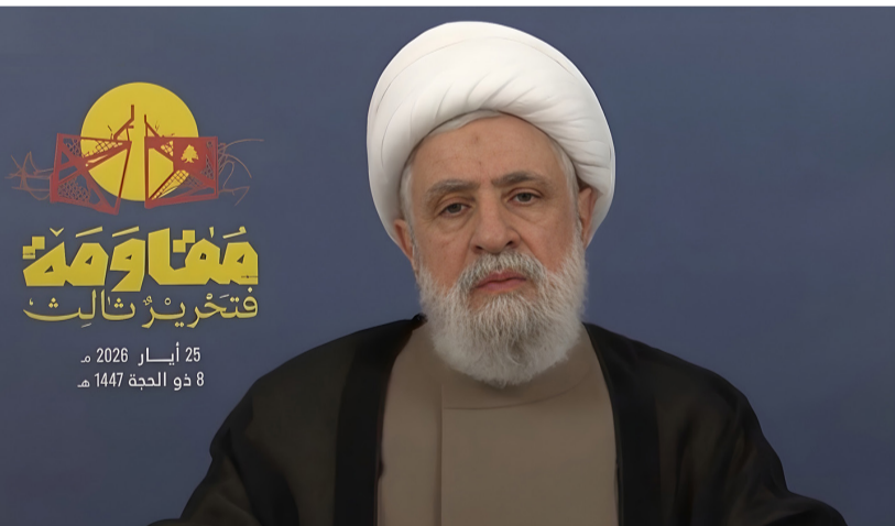
مناقشة فتحير ثالث

في القسم الإقليمي من الخطاب، أعاد الشيخ قاسم تثبيت فلسطين كـ «بوصلة»،