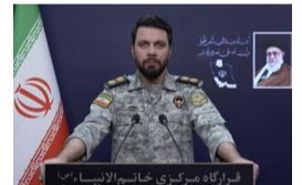
المرتكزات المركزية خاتم الأنبياء (ص)