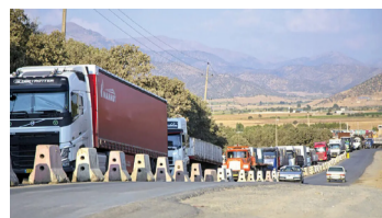
وأوضح مدير عام مكتب نقل البضائع في منظمة الطرق والنقل البري: في الفترة

المذكورة، ويهدف توفير السلع الأساسية التي يحتاجها المواطنون، تم نقل مليونين و ٩٢٠ ألف طن من مختلف أنواع السلع الأساسية عبر موانئ البلاد، وتم نقلها وتوزيعها في جميع أنحاء البلاد. وأشار إلى أن كمية نقل السلع الأساسية في الفترة من فبراير إلى ٨ أبريل ٢٠٢٦ مقارنة بالفترة المماثلة من العام الماضي، قد شهدت نمواً بنسبة ٢٠ بالمئة.