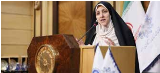
مساعدة رئيس الجمهورية لشؤون المرأة والأسرة: