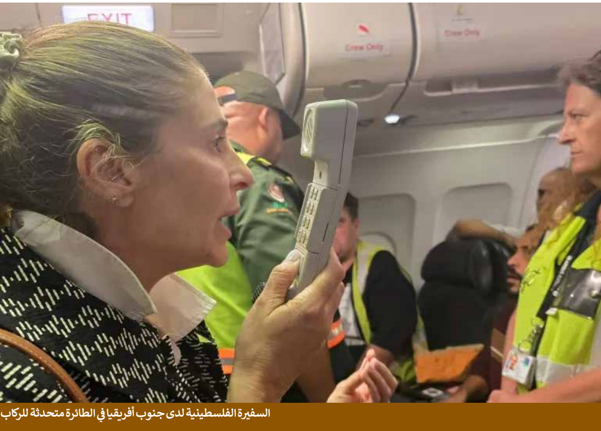
السفيرة الفلسطينية لدى جنوب أفريقيا في الطائرة متحدثة للركاب

الإعلام وكشف الغموض وسائل الإعلام العالمية لعبت دوراً محورياً في كشف تفاصيل هذه الرحلات. صحيفة «نيويورك تايمز» نشرت تقريراً موسعاً، فيما تناولت الجزيرة والغارديان القضية من زوايا مختلفة. الإعلام لم يكتفِ بسرد التفاصيل، بل طرح أسئلة حول الدوافع السياسية، وحول الدور الصهيوني، وحول مستقبل الفلسطينيين الذين وصلوا إلى جنوب أفريقيا. هذا الدور الإعلامي مهم لأنه يمنع كيان العدو من تمرير سياساته في الظل. عبر كشف الغموض، يُجبر الإعلام المجتمع الدولي على مواجهة الحقيقة: ما