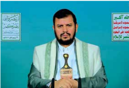
حساساً في منطقة بئر السبع بطائرة مسيرة. ما استهدفت العملية الثانية، هدفا

يُذكر أنه في أيلول/سبتمبر من العام الماضي، نقدّ سائق شاحنة أردني عملية إطلاق نار عند معبر الكرامة (اللني)، ما أسفر عن مقتل ٣ جنود صهاينة.