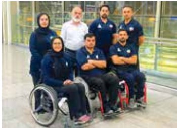
إشراف البطلة الدولية السابقة في الرماية «زهرا نعمتي».