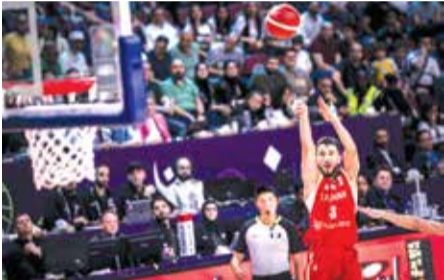
حقق المنتخب الوطني الإيراني لكرة السلة فوزاً سهلاً على نظيره السوري بنتيجة ٤٢-٣٨ في بطولة كأس آسيا الجارية في جدة.

وجاء المنتخب الإيراني في المجموعة الثانية مع كل من «لبنان، السعودية والكويت». وهذا وستنطلق منافسات هذه التصفيات اعتباراً من ١٣ ولغاية ١٧ من أكتوبر القادم، وستجري منافسات مجموعة إيران في السعودية؛ وسيتأهل من كل مجموعة فريق واحد فقط؛ حيث سيخوض النهائيات ١٢ منتخباً، ٨ منتخبات من هذه التصفيات بالإضافة إلى كل من «الصين (مستضيف البطولة) –كوريا