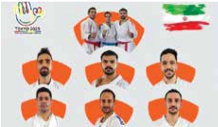
ومن الجدير بالذكر ان هذه الاعاب الاولمبية للصم ستقام في اليابان للفترة من ١٥ نوفمبر ولغاية ٢٧ منه.