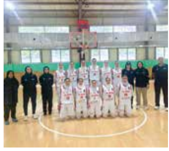
تقريباً بنفس الفريق «عام ٢٠٢٣» وأصبح الان أكثر تجربة وفراصة.

الثاني في المجموعة الثانية مع منتخبات «جزر الكوك» و«مغوليا وتايلند»، وسواجه في أول لقاء منتخب جزر الكوك. وأوضح الاتحاد الدولي لكرة السلة في تقرير له بصفتها الخاصة بالفضاء المجازي أن منتخب إيران للسيدات هو أحد الفرق المرشحة بقوة للتأهل عن هذه المجموعة والصعود إلى