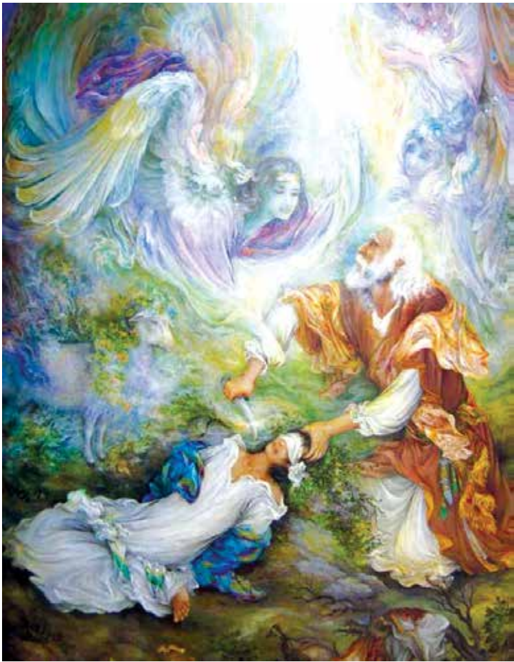
لوحة «الإختبار الكبير» للفنان الإيراني «محمود فرشچيان»