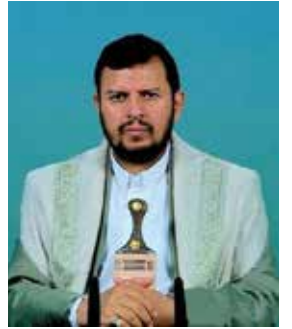
السيد الحوثي: ما يجري في سورية هندسة أميركية - صهيونية

أكد قائد حركة أنصار الله في اليمن، السيد عبد الملك الحوثي، أنّ "ما ترتكبه الجماعات التكفيرية في سورية من إجرام هو مُدان ويجب أنّ يستنكره الجميع وأنّ يسيء كلّ من بقي له ضمير إلى وقف الجرائم".