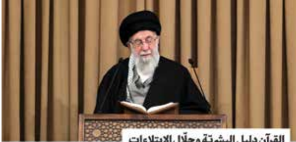
٢٢ براد في سادات المحيية على سادات الامام علي (ع) في حاشية معناه بعدة اجابات بعدة اللغات من ضمن ان الحرف بالانجليزية بمنهج القرآن في حاشية واهل بيته