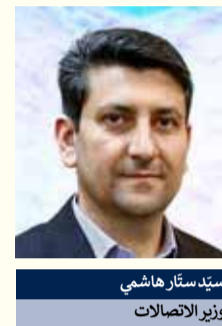
سيد ستار هاشمي وزير الاتصالات

كتب وزير الاتصالات وتقنية المعلومات الإيراني "ستار هاشمي" مقالاً يوضح فيه متابعة الدبلوماسية التكنولوجية الإيرانية في القارة الأوروبية، خاصة زيارته بلغراد، بهدف تطوير العلاقات التي تركز على الدبلوماسية التكنولوجية.