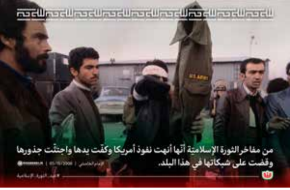
من مفاخر الثورة الإسلامية أنها أنهت نفوذ أمريكا وكنت يدها واجتحت جزورها وقضت على شبكاتنا في هذا البلد.