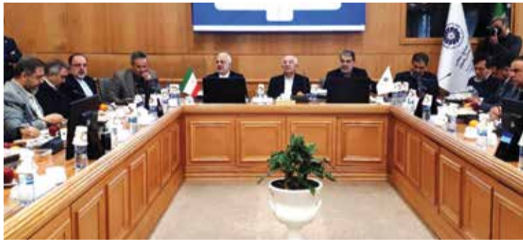
نائب وزير الخارجية للشؤون القنصلية والبرلمانية:

وأكد اسلامي إن حصة إيران في الوقت الحاضر من سوق الماء الثقيل في العالم هي ١٢/٥٪، أي إننا إن أردنا البيع، فإن حصتنا ستزيد عن ذلك، لأن هناك طلباً متزايداً عليه.