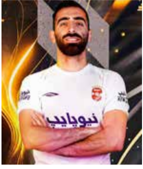
دوري أبطال آسيا لكرة الصالات في عام ٢٠١١.