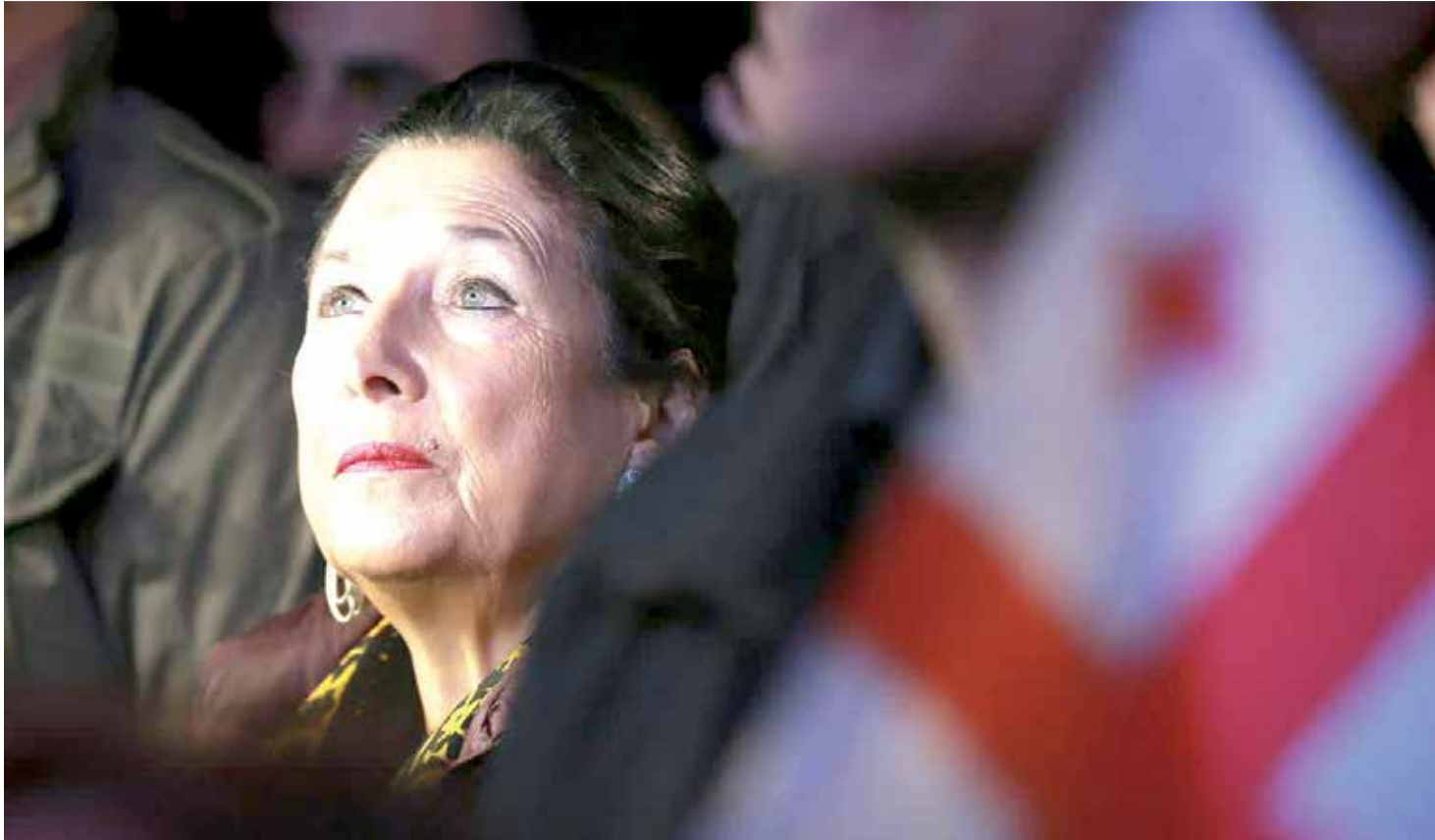
الرئيسة الحالية لجورجيا "سالومي زورابيشفيلي"

اقتضت الحكومة الفيدرالية الباكستانية خلال الأشهر الثمانية الماضية مبلغ ٤ تريليون و ٣٠٤ مليار روبية (ما يعادل ١٥ ملياراً و ٥٣٨ مليون دولار) من البنوك المحلية والأجنبية لتغطية نفقاتها وسداد ديونها وفوائد القروض السابقة. ووفقاً لتقرير البنك المركزي الباكستاني، فقد بلغ إجمالي الديون الحالية للحكومة الفيدرالية الباكستانية ٦٩ تريليون و ١١٤ مليار روبية (ما يعادل ٢٥٠ مليار دولار). ومن هذا المبلغ، تدين الحكومة الفيدرالية الباكستانية بمبلغ ٤٧ تريليون و ٢٣١ مليار روبية للبنوك المحلية (ما يعادل ١٧٠ ملياراً و ٥٠٠ مليون دولار)، و ٢١ تريليون و ٨٨٤ مليار روبية (ما يعادل ٧٩ مليار دولار) للبنوك والمؤسسات الأجنبية.