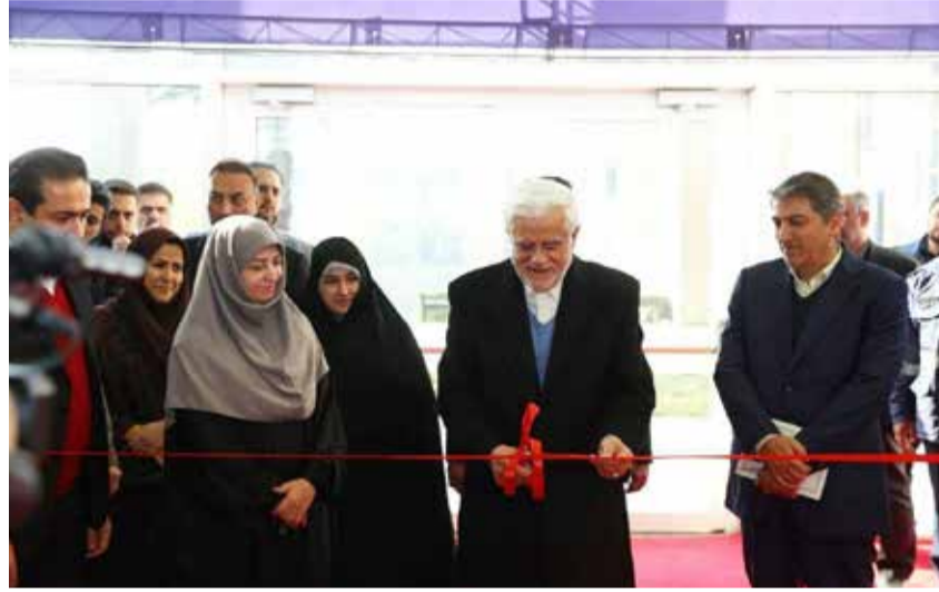
النائب الأول لرئيس الجمهورية خلال افتتاح المعرض الدولي للبيئة:

علينا حل القضايا البيئية بعيداً عن العامل السياسي من خلال التعاون الإقليمي والدولي