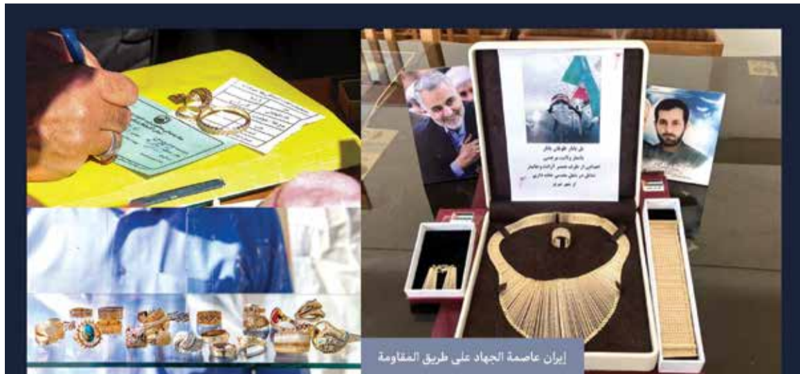
إيران عاصمة الجهاد على طريق المقاومة

في اليوم الذي أعلن فيه خبر استشهاد الأمين العام الراحل لحزب الله، السيد حسن نصر الله؛ أعلن الإمام الخامني في بيان أن الوقوف إلى جانب الشعب اللبناني وحزب الله الشامخ واجبٌ على جميع المسلمين. شكّلت هذه الرسالة في إيران موجة من التعاطف والتضامن مع الشعبين المظلومين في لبنان وفلسطين. تضافرت الجهود