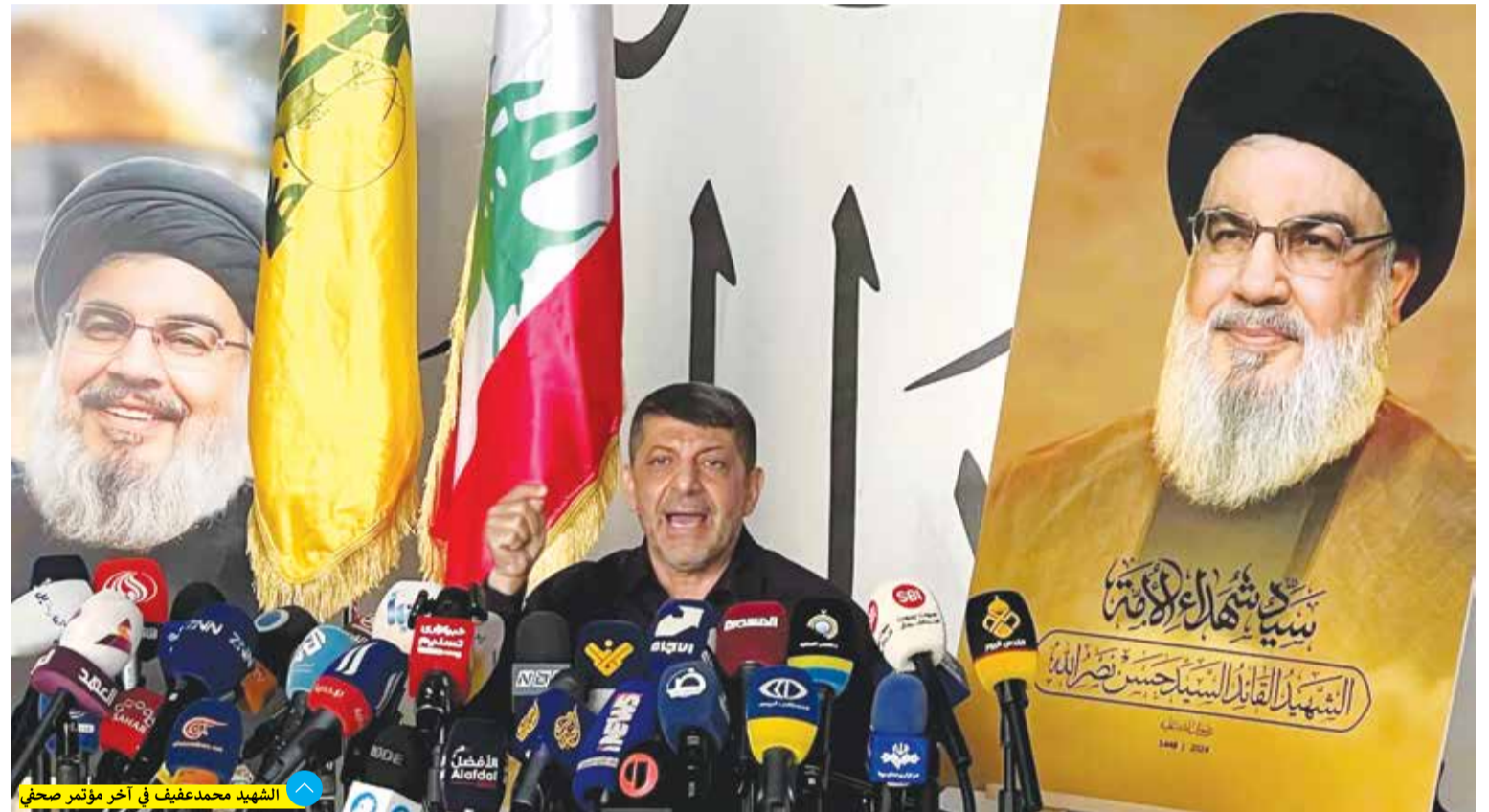
الشهيد محمد عفيف في آخر مؤتمر صحفي