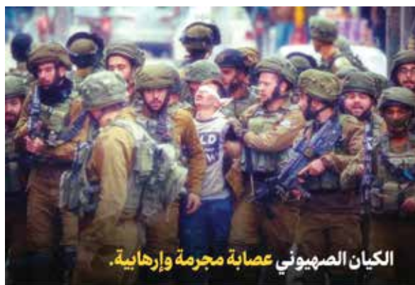
الكيان الصهيوني عصابة مجرمة وإرهابية.