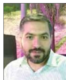
محمد باقر الحكيم