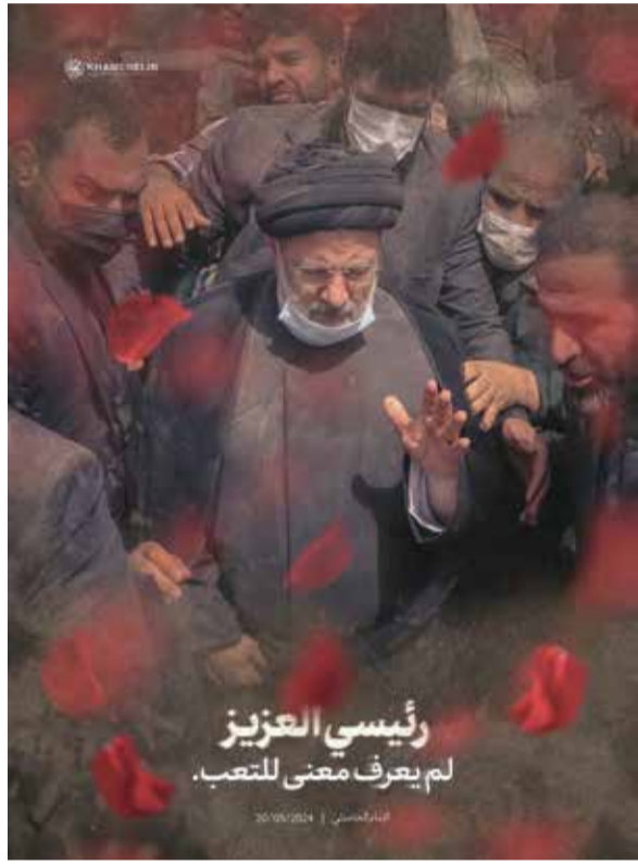
رئيسي العزيز لم يعرف معنى للتعب.