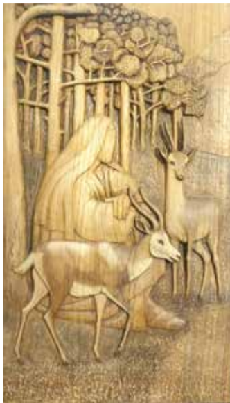
لوحات خشبية في متحف العتبة الكاظمية المقدسة، تم عرضها في جناح العتبة بمعرض طهران الدولي للكتاب