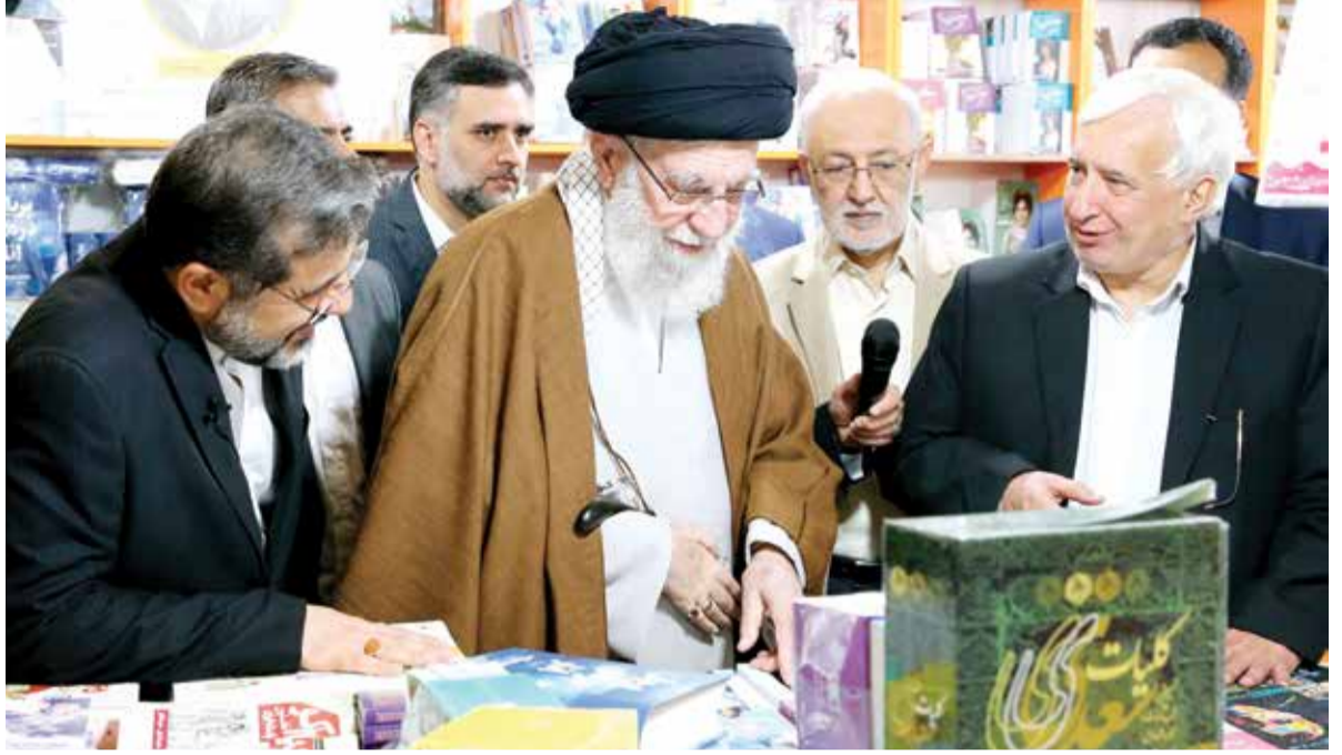
قائد الثورة بعد زيارته التفقدية التي استغرقت ٣ ساعات لمعرض الكتاب: