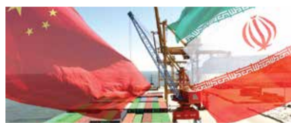
٩١٪ من الصادرات من المنتجات النفطية

قال رئيس غرفة التجارة الإيرانية - الصينية: أن ٩١٪ من الصادرات الإيرانية إلى الصين هي من المنتجات النفطية. وأضاف مجيد رضا حريري: إن أكثر من ٣٣٪ من الصادرات غير النفطية لإيران كانت إلى الصين خلال السنوات الماضية، وهذا البلد يشكل أكبر سوق لبضائعنا التصديرية. وتابع: فيما يتعلق بتركيبة صادراتنا، إن أكثر من ٨٠٪ من السلع المصدرة إلى جميع الدول، بنا على إحصائيات الجمارك، تستند إلى