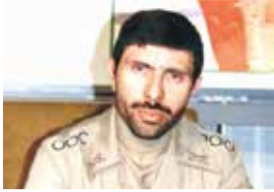
الشهيد علي صياد شيرازي