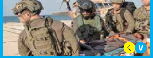
تفجير عبوات ناسفة بقوة من «غولاني».. والعدو يعترف بإصابة ٤ جنود