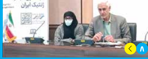
تكريم ٣ ناشطين إيرانيين لجائزة المؤتمر الدولي لعلم الوراثة