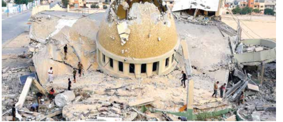
المساجد المهتمة في غزة