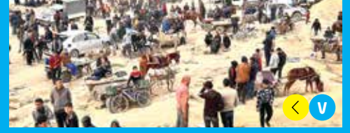
مجزرة الجياع.. جريمة مشينة يرتكبها العدو في غزة