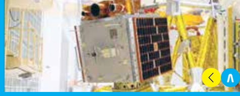
«بارس 1» يرسل بيانات بأقصى دقة