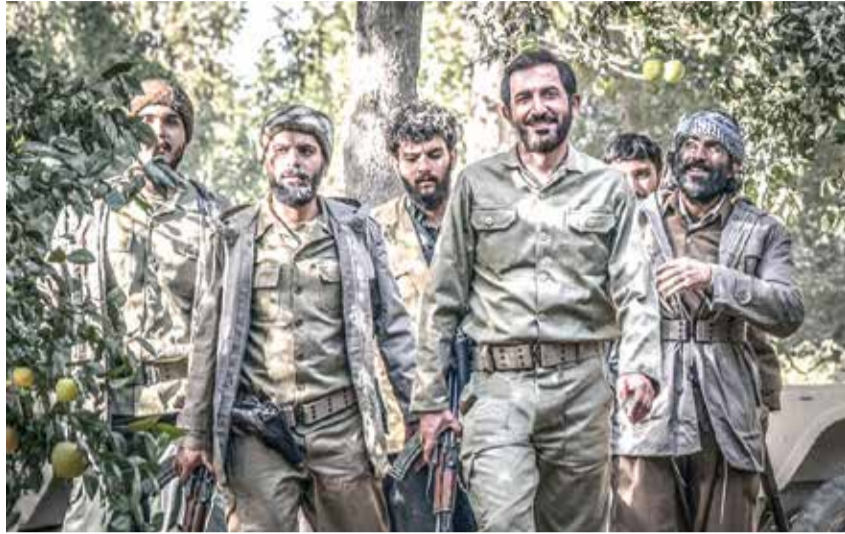
فيلم «قائد الفرقة ٣١»