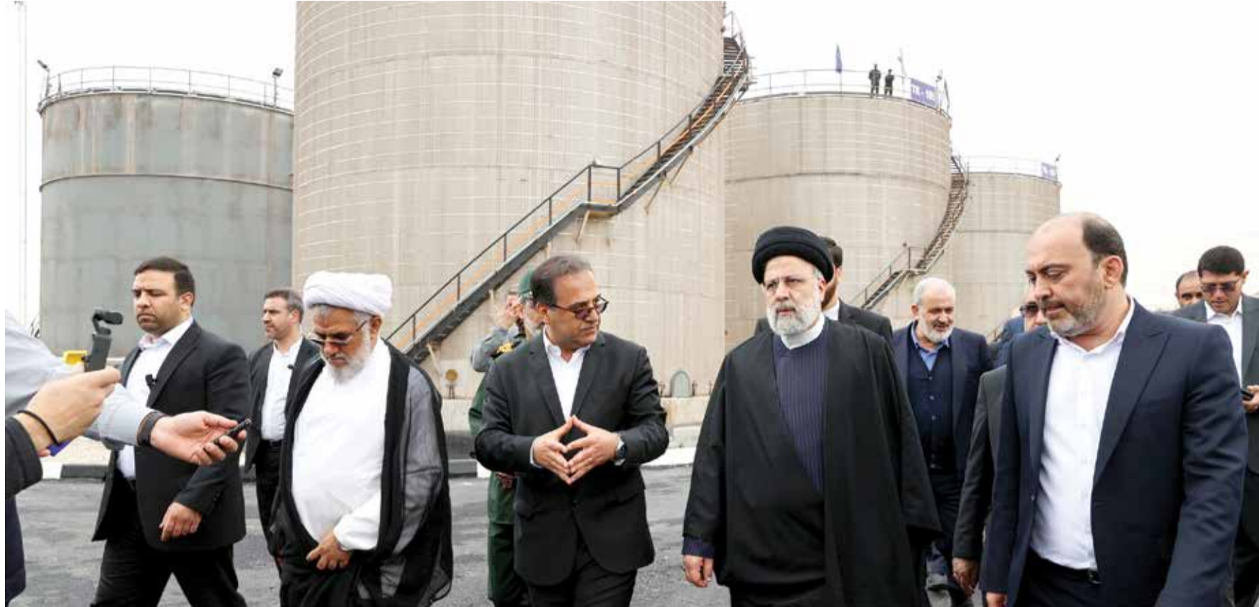
رئيس الجمهورية لدى تدشينه ١٥٧ مشروعاً صناعياً في محافظة هرمزگان