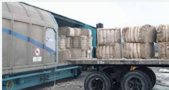
الوحيد في شمال إيران (على بحر قزوين) الذي يتمتع بهذه الميزة، وقال: تقديم الخدمات المثلى من قبل الأجهزة

وأعرب مدير المنطقة الاقتصادية لميناء أميرآباد عن ارتياحه لازدهار النقل السككي للبضائع إلى الميناء