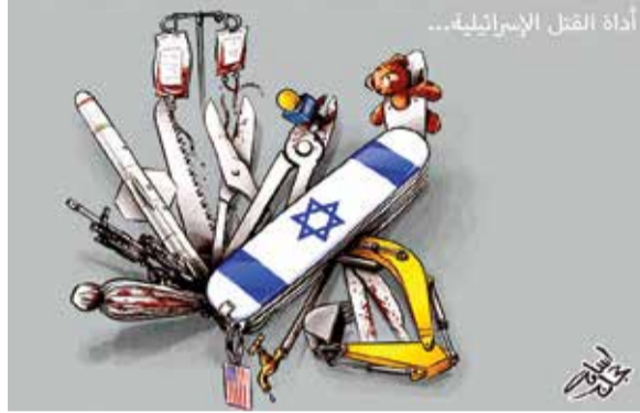
أداة القتل الإسرائيلية...