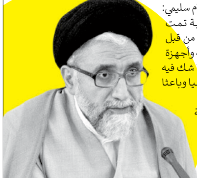
وزير الأمن يتوعد بمعاينة مرتكبي هجوم «راسك» الإرهابي