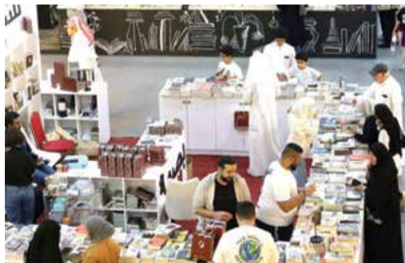
معرض الكويت الدولي للكتاب

ويضم المعرض أنشطة أخرى منها "العازفون الهواة" و"جدارية الفنانين" و"أنت نجم الغلاف" و"المجلس في صورة" وألعاب تفاعلية وتصفح الإصدارات الأولى، بالإضافة لمناظرة النشر الورقي والإلكتروني ومسابقة جوائز الطلبة المبدعين.