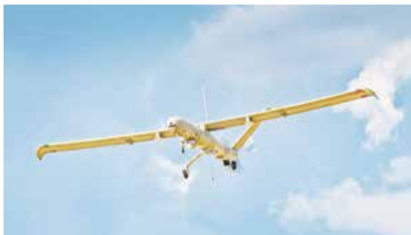
مسيّرة إسرائيلية من نوع "هيرميز ٤٥٠"

غزة ومظلومي فلسطين". بدوره عضو المكتب السياسي لأنصار الله علي القحوم أكد أن المعادلة التي رسمها اليمن وصنعها على الواقع، لا مناص منها في مناصرة قضايا الأمة وعلى رأسها القضية الفلسطينية والقدس، وهي القضية الأولى والمركزية. هي معادلة ثابتة ومبدئية حتى في ظل التكالب الأمريكي والغربي مع الكيان الصهيوني الغاصب في العدوان على غزة.