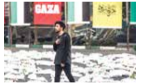
لدعم أطفال غزة

ومضى يقول إن زيارة الرئيس الإيراني إلى أوزبكستان وطاجيكستان حققت إنجازات جيدة للغاية، وقال: "بين المدن التاريخية في إيران وأوزبكستان، مثل سمرقند وأصفهان وبخارى وهمدان، وكذلك بين المدن التاريخية في إيران وطاجيكستان تم التوصل إلى اتفاق أخوة بين مدينتي خوجند الطاجيكية ويزد الإيرانية". وأكد اسماعيلي: "إن توسع التفاعلات الثقافية، والحضور الكبير للإيرانيين، والغناء والتأثيرات مع طاجيكستان، كانت من بين الأحداث المهمة التي تم تحقيقها خلال هذه الرحلة، وقريباً سيكون لدينا عدة أسابيع ثقافية في البلاد والدول المجاورة منها دولة قطر".