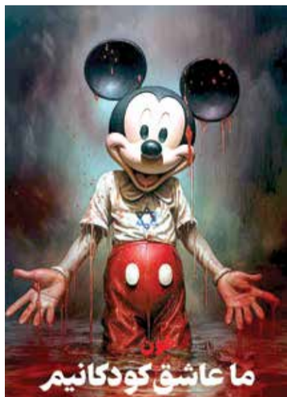
لوحة ديزني "ميكي ماوس ملطخ بالدماء"

الفن مرآة الزمان الفن بأي شكل من الأشكال يجب أن يكون مرآة شاملة لزمانه وعصره، وبالإسناد فن لا يواكب أحداث العالم وتطورات، ولا يبالي بما يحدث في أقاليم العالم، يعتبر عديم الفائدة وغير فعال، وكأنه فقد حيويته وديناميكيته وخصوبته. ويمكن القول إننا شهدنا خلال عملية طوفان الأقصى الكبرى إنفعلاً فظرياً لدى الفنانين الذين فهموا واجبه بشكل صحيح في هذه اللحظة التاريخية المهمة وعملوا جاهدين على إبداع أعمال أظهرت روح الإلتزام بالحقيقة. بهذه المقدمة، نستعرض اليوم مجموعة مختارة من أعمال فنانين ملتزمين في مجال الفنون التشكيلية ولوحات فنية تطرقت إلى طوفان الأقصى وجرائم الكيان الصهيوني في قتل الأطفال الأبرياء. مع توضيح أن ما يلي لا يتضمن سوى جزء بسيط من نشاط الفنانين من أجل خلق أعمال فنية تليق بعملية طوفان الأقصى، إضافة إلى المعارض الفنية المختلفة التي تمت إقامتها في مختلف أنحاء إيران وتتضمن لوحات فنية وصور من هذه العملية وما يجري اليوم في غزة.