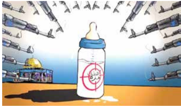
إبادة أطفال غزة !!