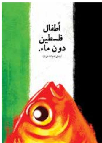
لوحة الفنان «محسن فرجي»