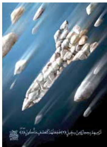
لوحة «الأحجار تتحول إلى صاروخ»