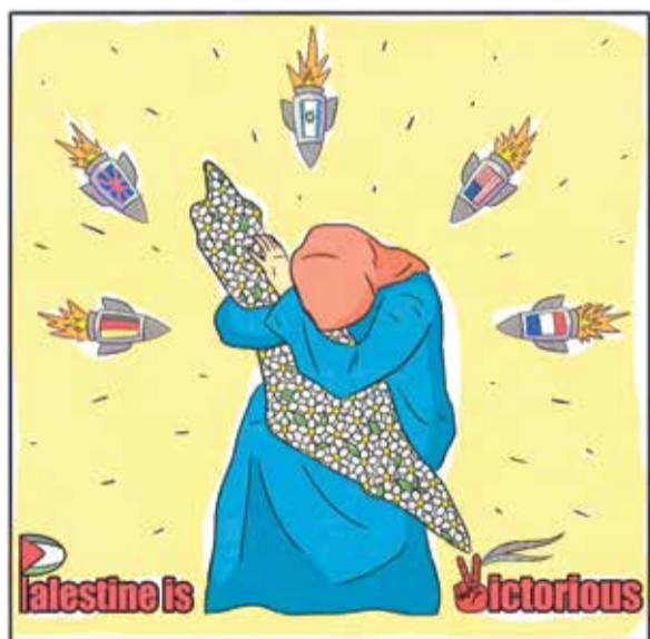
لوحة الأم تحتضن فلسطين