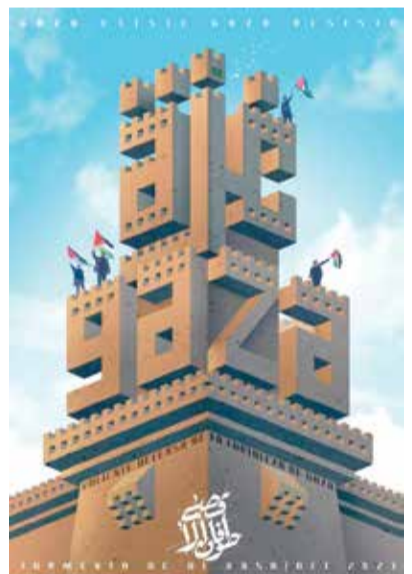
لوحة مجسم غزة

الوعد للفن الإسلامي، حيث يقول في معرض الأنشودة: "إنهم في القلب شئ ويخافون الممات، خلف جدران تواروا، جنبهم يهوى الحياة". وصار الميل أوضح نحو مديح السلاح (الصاروخ - الكلاشينكوف). كما اختصرت المساحات التي يحتلها وصف جرائم العدو لصالح ما وصفه الفنانون، كما في أنشودة "يا قدس إنا قادمون" لنفس الفريق، وصار العدو في الأغنية يظهر بعبارات شديدة الإحتزاز مثل: عدو، محتل، صهيوني، إسرائيلي، قاتل. ولعل الأغنية الشعبية الفلسطينية وقولها وأنماطها مثل زريف الطول، والدلعونا والعتاب والميجانا، استحوذت على جزء كبير جداً من الأغاني المقاومة التي ما تزال تتردد إلى يومنا هذا، وسبقى ترددت ككريات وتراث جميل في المستقبل، بعد تحرير فلسطين من البحر إلى النهر.