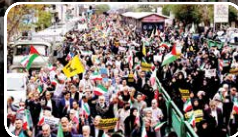
إيران - طهران