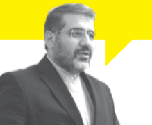
وزير الثقافة: سينما الأطفال واليافعين، المستمدة من العالم النقي والضمير الحي للأطفال، والتي تزرع الحياة والرغبة بالتميز في عقولهم المبدعة، وهي بمثابة سينما ثقة الأسرة الإيرانية ومرآة كاملة للأخلاق والنقاء، تعلم الأطفال مفاهيم العيش الصحيح باستخدام المواهب الفنية

بعد أن يُنهي الكاتب بحثه عن التجربة الإسلامية الحديثة والمعاصرة في فلسطين، يعتبر أن ما يجري هو صراع وجود وليس صراع حدود، وأنه كما واجه المسلمون الصليبيين والتتار، فهم يعملون على مواجهة المحتل الغاصب، مدعومين من ساحات عربية وإسلامية متكاتفة لا تنفصم عُراها. وقد بات واضحاً اليوم أن النضال الفلسطيني المتكاتف في الداخل يركز خارجياً على أرض صلبة منذ انتصار الثورة الإسلامية في إيران. فحدث رفع من أسهم القضية الفلسطينية لدى الشعوب العربية والإسلامية من خلال دعوة