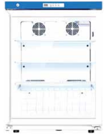
إلى أن مسجل البيانات يراقب بشكل مستمر درجة الحرارة داخل الثلاجة، وقال: يقوم هذا

تمكن باحثون من الحفاظ على سلامة الأدوية واللقاحات من خلال عمل أجهزة تسجيل بيانات لثلاجات الأدوية لمراقبة وتسجيل درجات الحرارة. حول هذا الموضوع صرح محمد نقي بور المدير التنفيذي لشركة قائمة على المعرفة: "يعد مسجل بيانات لثلاجات الأدوية أداة ممتازة لرصد وتسجيل بيانات درجة الحرارة وضمان التخزين السليم شروط الأدوية واللقاحات الحساسة." وبين أن مسجل البيانات هو جهاز صغير يمكن وضعه بسهولة داخل الثلاجة، وقال: إن هذا الجهاز الصغير مصمم لقياس وتسجيل درجة الحرارة على فترات منتظمة في هذه الشركة. وأكمل نقي بور: إن استخدام مسجل بيانات لثلاجات الأدوية يضمن الامتثال لأنظمة درجة الحرارة ويساعد في الحفاظ على سلامة الأدوية واللقاحات. مؤكداً أن الشخص يشعر بالطمأنينة عندما يعلم أن المنتجات الحساسة لدرجة الحرارة يتم تخزينها في ظروف مثالية. وأشار