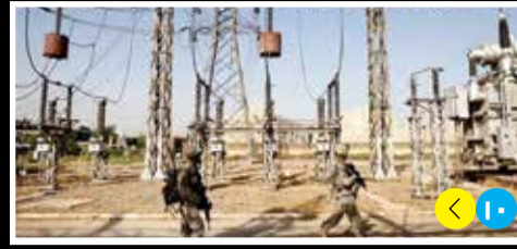
لحماية أبراج الطاقة.. إنطلاق عملية تفتيش في 3 مناطق