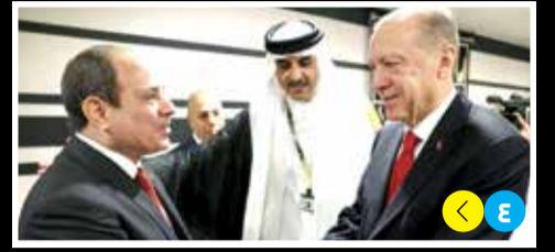
هل تضرب تركيا آخر مسمار في نعش علاقتها مع الإخوان؟