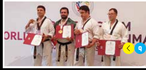
٣١ ميدالية ملونة .. حصاد إيران بالتايكواندو