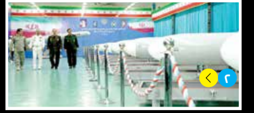
صاروخ «أبو مهدي».. كابوس البوارج وحاملات الطائرات

السنة السابعة والعشرون ● العدد ٧٢٩٣ ● الأربعاء ● ٨ محرم ١٤٤٥ ● ٢٦ يوليو ٢٠٢٣ ● ١٢ صفحة ● إيران: ٤٠٠٠ ريال ● لبنان: ١٠٠٠ ليرة ● سوريا: ه ليرات