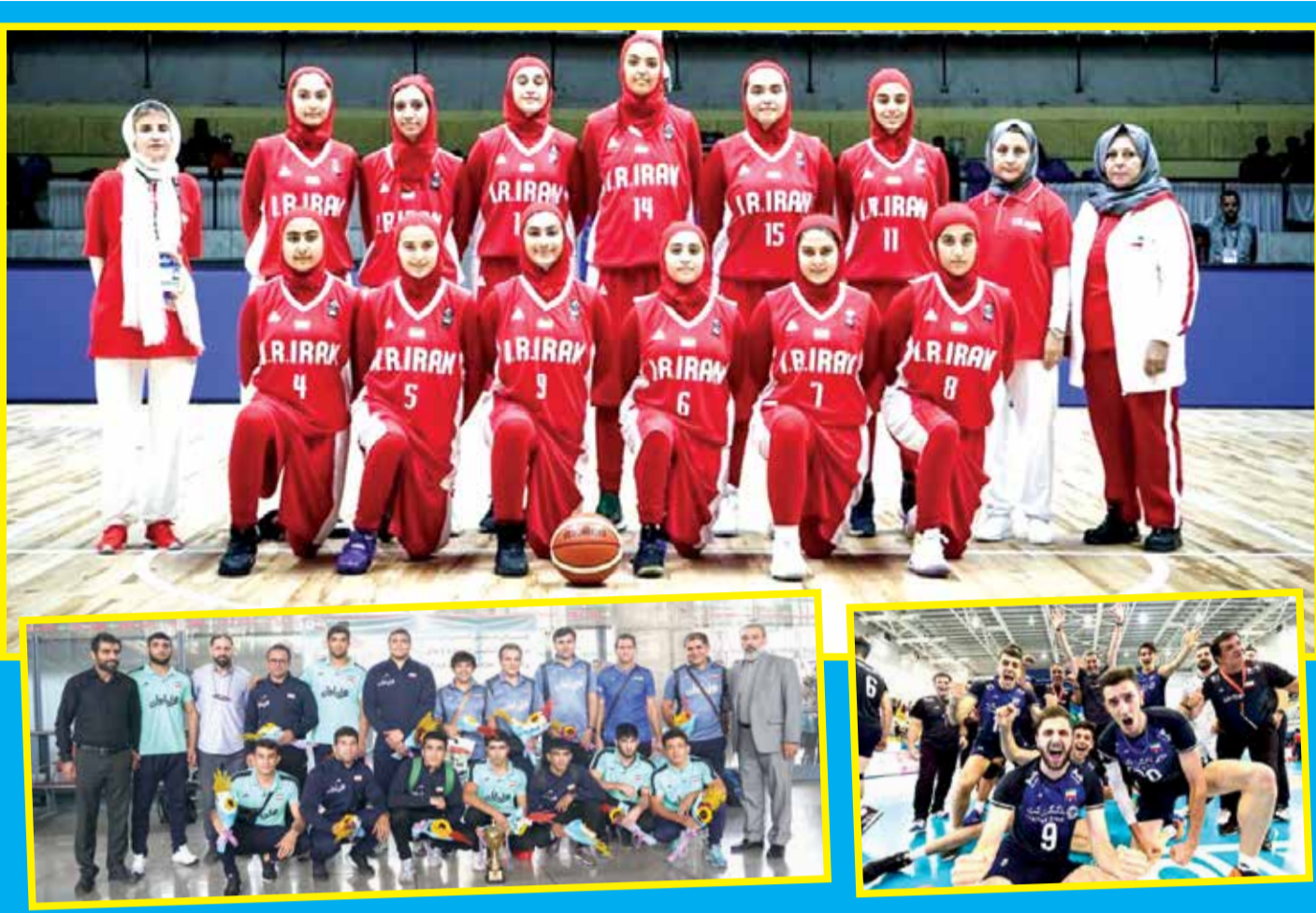
منتخب كرة السلة الإيرانية يتسلم كأس بطولة آسيا في طهران، بحضور المسؤولين الإيرانيين والوفد الصيني.

تنقسم القلعة إلى جزئين القديم والجديد، حيث يعود الجزء القديم إلى العصر الأشكاني أو الفرثي، أما الجديد فتم بناؤه في العصر الصفوي