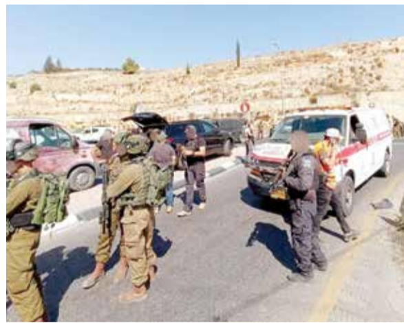
الفضائل الفلسطينية: عملية تقوع تكشف من جديد هشاشة العدو