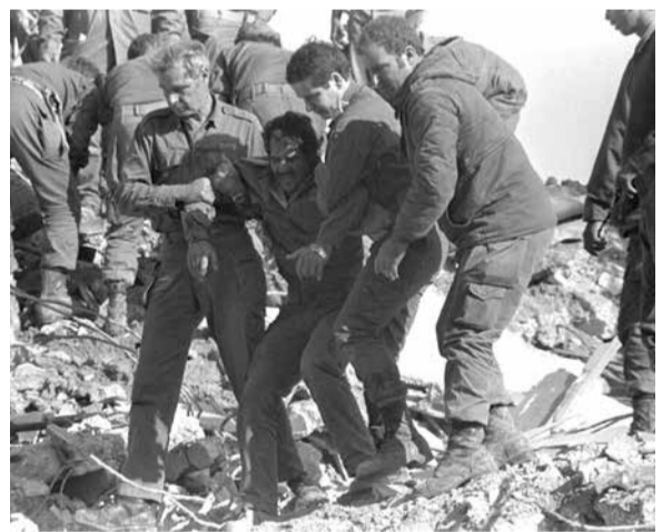
العدو الصهيوني يُعيد تحقيقاته بعد أربعة عقود

وسعت قوات الدعم السريع لاستعادة هذا المعسكر بوصفه أحد أكبر المعسكرات التي يتم التزوّد منها بالعتاد والذخيرة. ونقلت وكالة الصحافة الفرنسية عن ضابط في الجيش السوداني أن المعارك في محيط مقر الاحتياطي