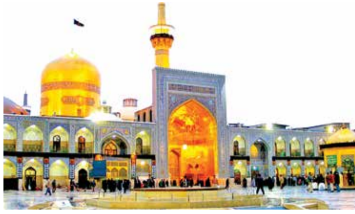
مرقد الامام الرضا(ع)

شعب لديه هكذا قيادة عظيمة ويمتلك هذا الوفاء لا يمكن ان ينهزم... لذا لا اسف على بقائنا دون مواقع التواصل ولو لاشهر لان ما شاهدناه ولمسناه يكشف زيف الكثير مما يقال في الاعلام الغربي المعادي.