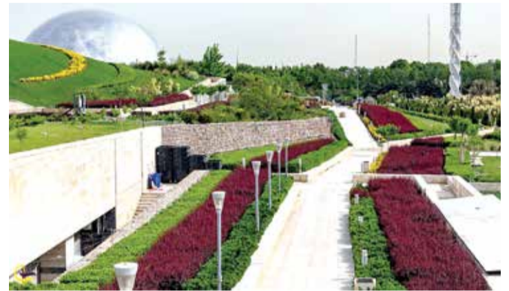
متنزه الماء والنفاري طهران