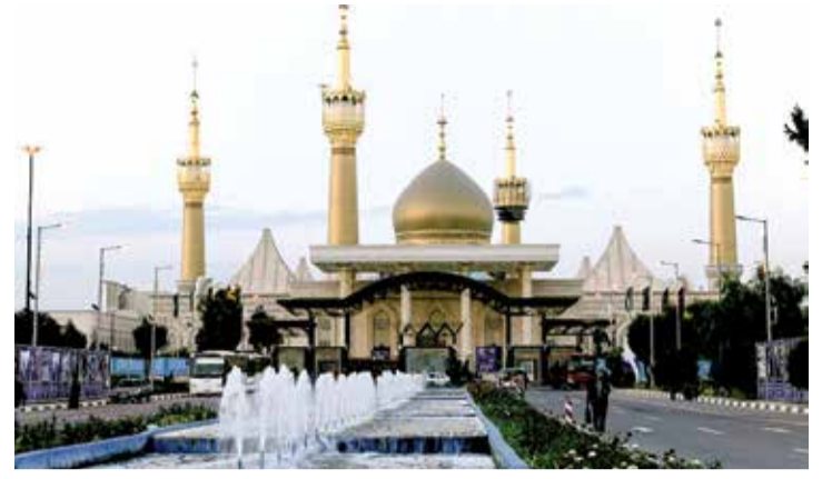
مرقد الامام خميني (قدس)