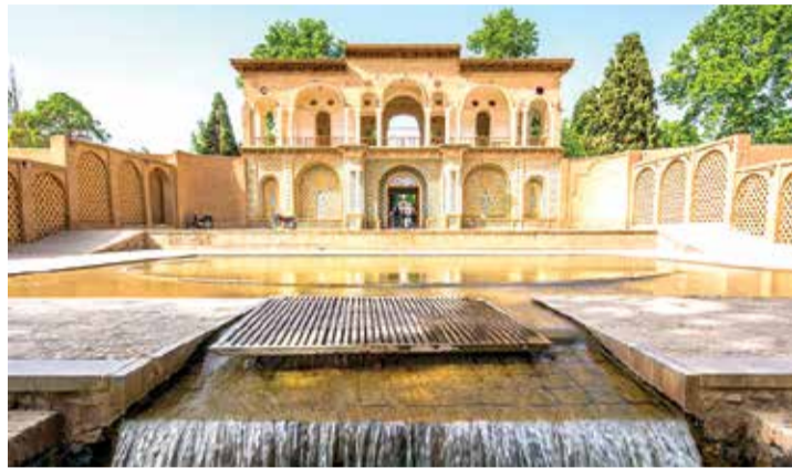
معلم بشاهزاده ماهان في كرمان